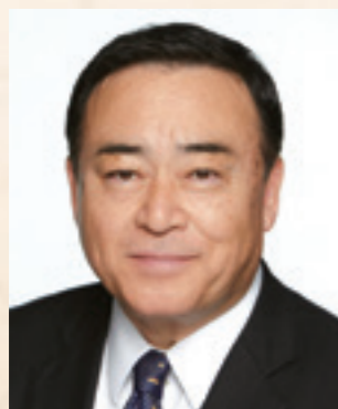
内閣府特命担当大臣 (地方創生・規制改革) 梶山 弘志

「地方創生」の実現には、地域の皆様が、自ら危機感を持ち、自主性を持って意欲的に取り組み、持続的に稼ぐことが重要です。そのためには、地域の中堅・中小企業が、潜在的に有する「稼ぐ力」を発揮し、地域経済を盛り立てていくことが求められます。