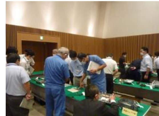
電動化に対応していく上での課題