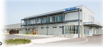
2013年に館林市下早川田町建立された新本社工場→

群馬県館林市出身。1992年、短大卒業後貿易商社に入社後に渡米。2002年、Northeastern University 卒業後、手島精管株式会社へ入社。2009年に再び渡米しHULT IBS MBA取得。2014年より同社代表取締役に就任し、現在に至る。2013年「群馬1社1技術」に選定。2016年、経済産業省「はばたく中小企業・小規模事業者300社」に選出。2017年、群馬県「地域未来牽引企業」に選出。